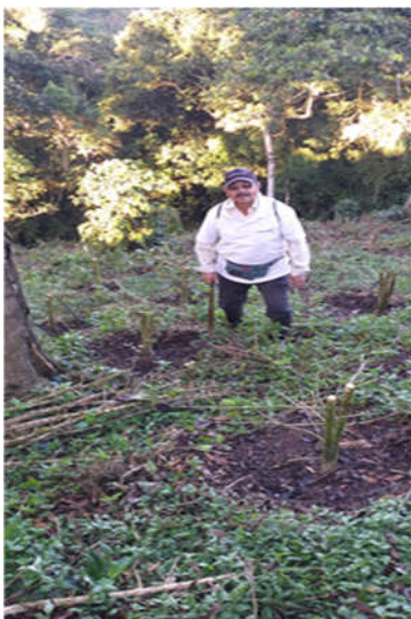
Obr. 5. Zoca común

Je dôležité spomenúť, že z aktuálneho počtu 5013 kávovníkov je 1634 určených pre zoca común (rez stonky 30 cm nad zemou) a 536 pre descope (zrezanie na 180 cm).