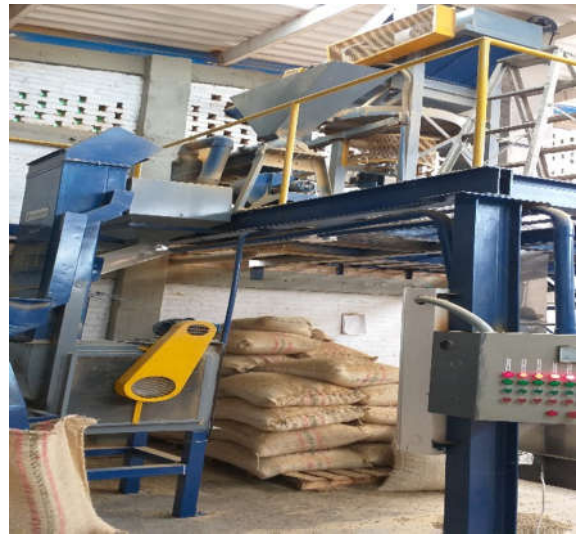
Obr. 10. Mlátička