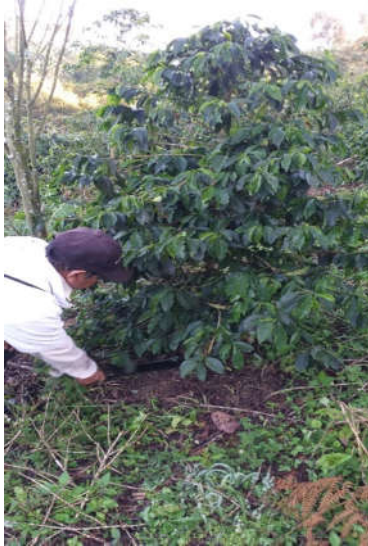
Obr. 3. Čistenie ručné