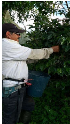
Obr. 1. Zber kávových čerešní na lote 18

Káva typu A a C nie je exportovaná, množstvo poslanej zelenej kávy excelso bolo: 700 kg