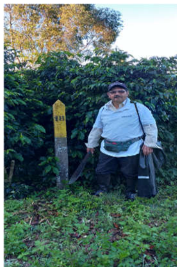
Obr. 6. Označenie lotu 18