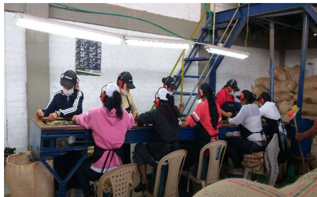
Obr. 12. Pásová selekcia