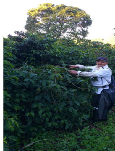
Obr. 4. Descope