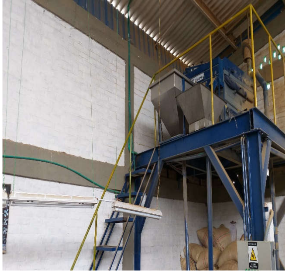
Obr. 11. Denzitometria