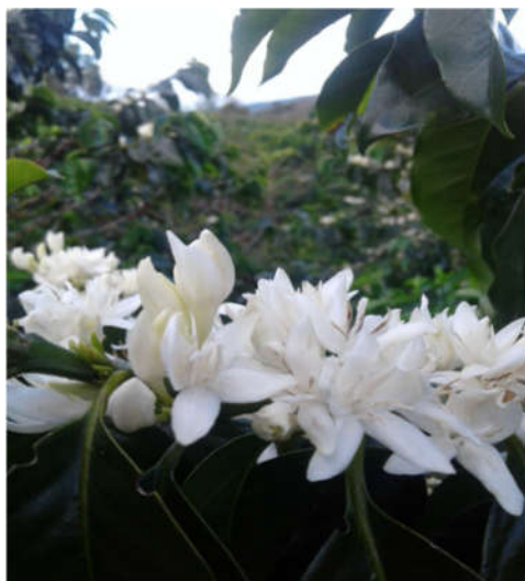
Obr. 7. Kvitnutie