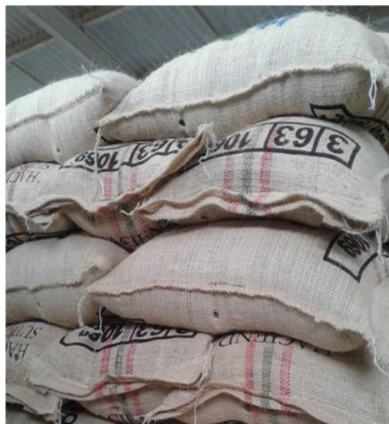
Obr. 8. Vývoz zelenej kávy