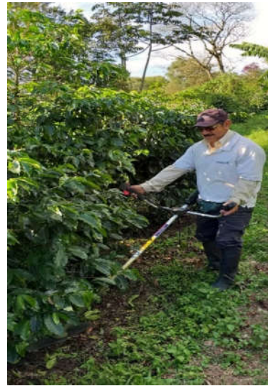
Obr. 2. Čistenie mechanické