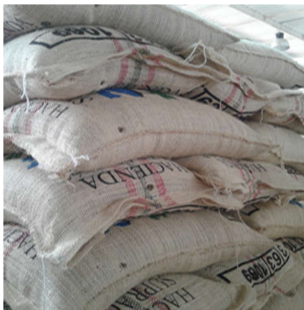
Obr. 9. Vrecia kávy

V roku 2018 vyprodukoval lot 18 (El Colibrí) 10 vriec zelenej kávy excelso, každé s hmotnosťou 70 kg.